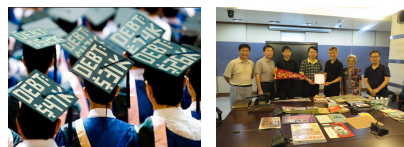
美華裔生多能申請到學貸 美華人捐贈華僑資料寶物