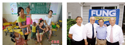
颱風後的海南文昌安置點 美華裔競選羅得島州州長